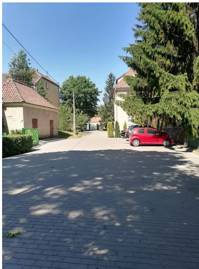
13. Zakończono budowę parkingu przy budynku dawnego kina perkoz w Pasymiu ( Centrum Aktywizacji Społecznej. Wartość zadania 120 000,00 zł