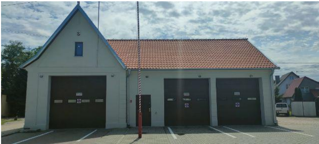
7. zakup samochodu ratowniczo gaśniczego dla jednostki OSP Pasym, koszt inwestycji : 1 215 155,50 zł z czego dofinansowanie ze środków Krajowego Systemu Ratowniczo-Gaśniczego wyniosło 500 000,00 zł.