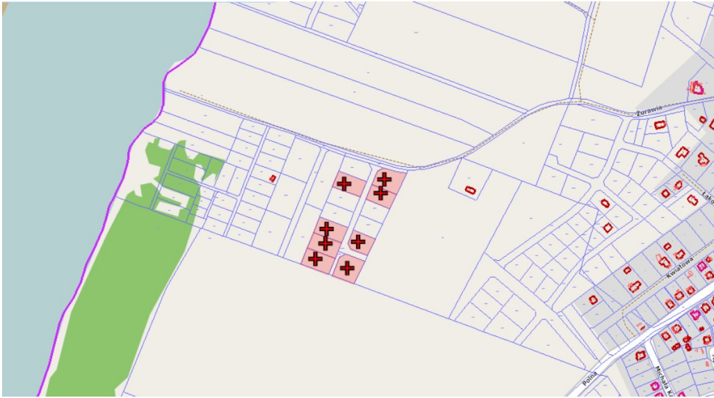
Działki do sprzedaży oznaczone są krzyżykiem

Dodatkowe informacje można uzyskać w Referacie Rozwoju Gminy Urzędu Miasta Pasym pokój nr 14, tel. (0-89) 621-20-11 wew. 34.