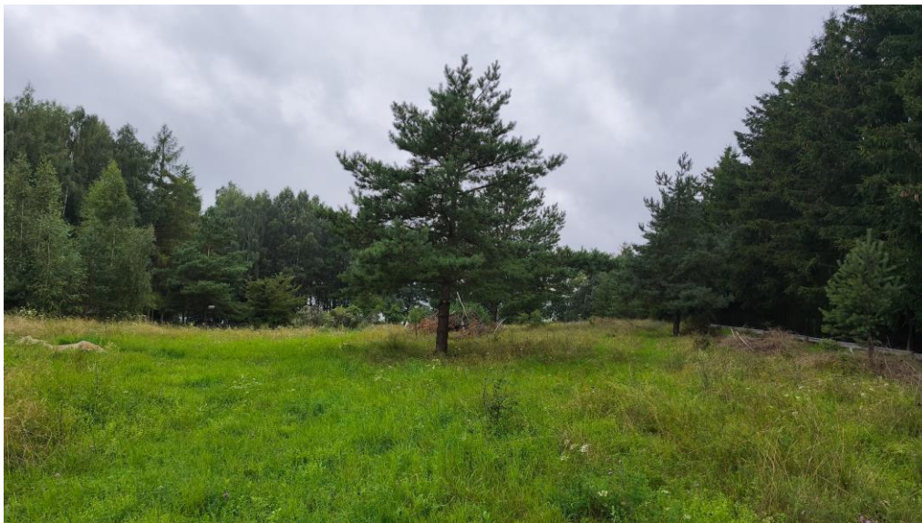
Fot. 1. Pojedyncze zadrzewienia– sosna pospolita, brzoza brodawkowata

Ukształtowanie terenu stanowi pozostałość po zlodowaceniu bałtyckim z przekształconą formą akumulacji lodowcowej i wodnolodowcowej z występującymi wysoczyznami falistymi. Charakteryzuje się łagodnym ukształtowaniem powierzchni o nachyleniu w kierunku jeziora Kalwa. Teren o prostych warunkach gruntowo-wodnych, przydatnych pod zabudowę. Kategorię geotechniczną całego obiektu budowlanego należy potwierdzić na podstawie badań geotechnicznych z właściwym określeniem warunków gruntowych zgodnie z rozporządzeniem Ministra Transportu, Budownictwa i Gospodarki Morskiej z dnia 25 kwietnia 2012r. w sprawie ustalania geotechnicznych warunków posadawiania obiektów budowlanych (Dz. U. z 2012r. poz. 463).