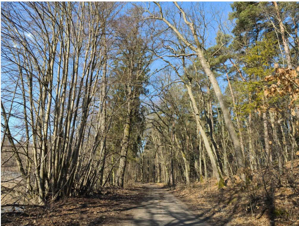
Fot. 3 Istniejąca roślinność okalająca jezioro Kalwa oraz fragment użytku leśnego

Ukształtowanie omawianego terenu stanowi pozostałość po zlodowaceniu bałtyckim z przekształconą formą akumulacji lodowcowej i wodnolodowcowej. Charakteryzuje się zróżnicowanym ukształtowaniem powierzchni. Teren o prostych warunkach gruntowo-wodnych, przydatnych pod zabudowę. Kategorię geotechniczną całego obiektu budowlanego należy potwierdzić na podstawie badań geotechnicznych z właściwym określeniem warunków gruntowych zgodnie z rozporządzeniem Ministra Transportu, Budownictwa i Gospodarki Morskiej z dnia 25 kwietnia 2012r. w sprawie ustalania geotechnicznych warunków posadawiania obiektów budowlanych (Dz. U. z 2012r. poz. 463).