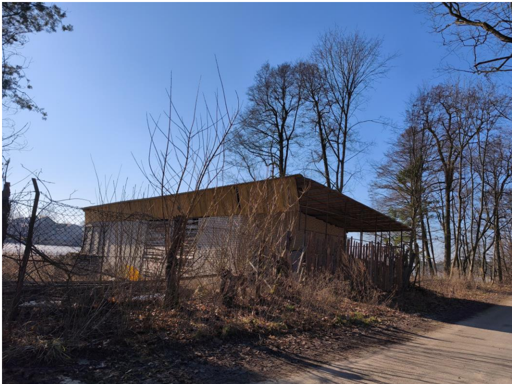
Fot. 2 Pozostałości zabudowy po byłym ośrodku wypoczynkowym