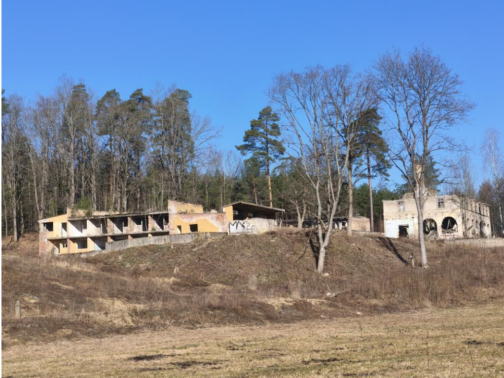
Fot. 1 Pozostałości zabudowy po byłym ośrodku wypoczynkowym