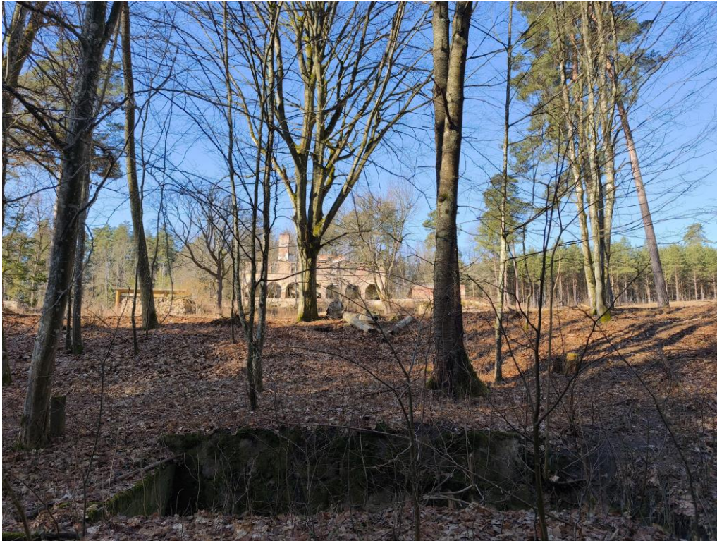
Fot. 3 Roślinność wysoka

Warstwę zielną omawianego terenu stanowią pospolite gatunki traw, bylin i chwastów. Roślinność wysoką reprezentują pojedynczo rosnące lub tworzące niewielkie grupy drzew: sosna pospolita, brzoza brodawkowata, lipa drobnolistna, klon pospolity.