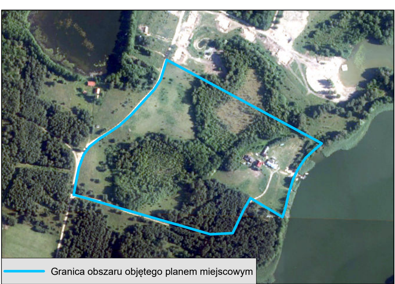
Granica obszaru objętego planem miejscowym